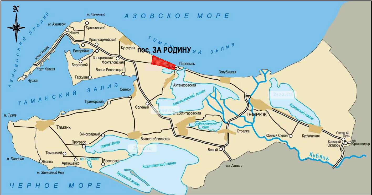
Схема размещения элемента планировочной структуры в границах Ахтанизовского сельского поселения. М 1:25 000.