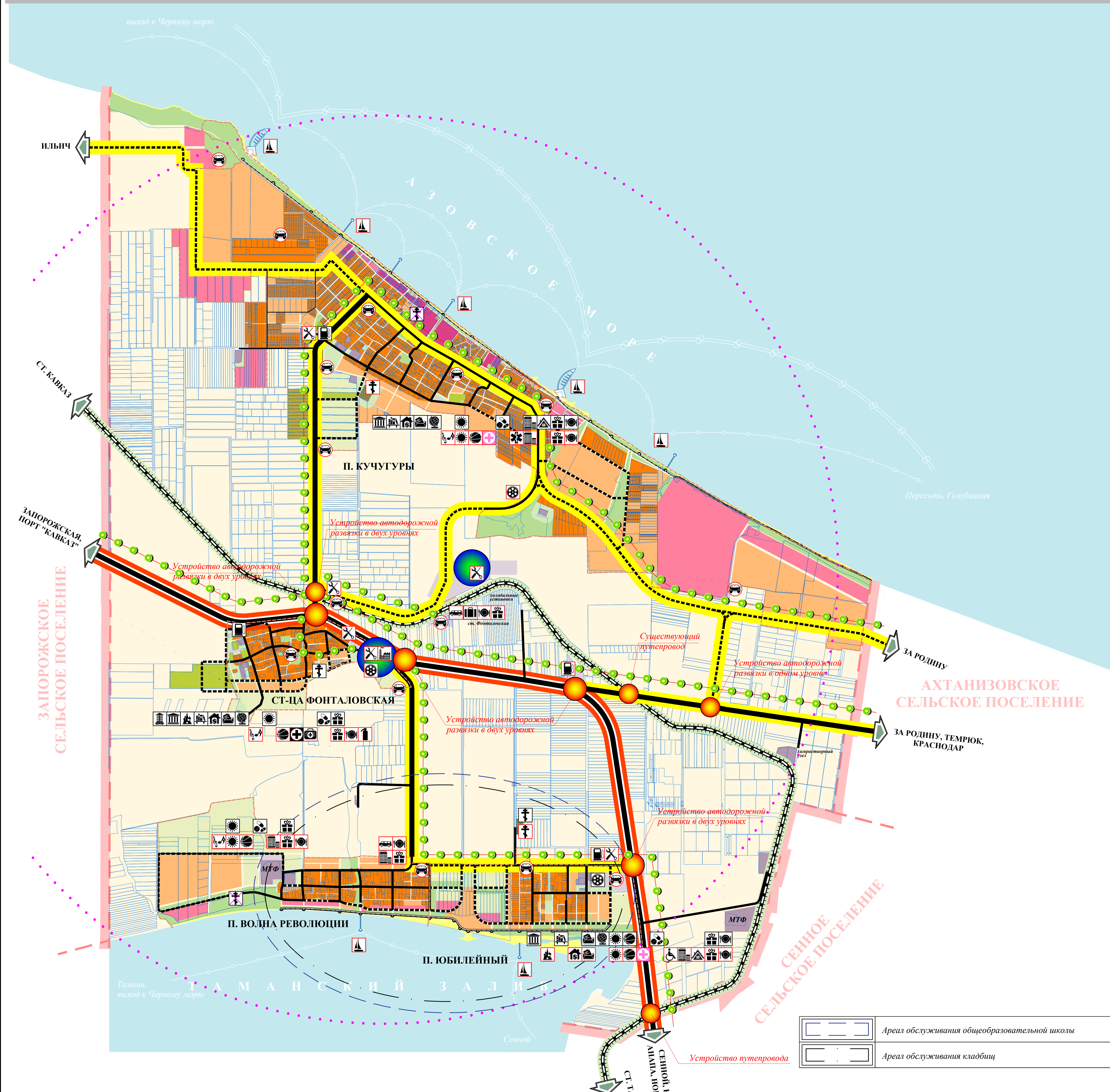
АВТОМОБИЛЬНЫЕ ДОРОГИ ОБЩЕГО ПОЛЬЗОВАНИЯ РЕГИОНАЛЬНОГО И МЕЖМУНИЦИПАЛЬНОГО ЗНАЧЕНИЯ, НАХОДЯЩИХСЯ В ГОСУДАРСТВЕННОЙ СОБСТВЕННОСТИ КРАСНОДАРСКОГО КРАЯ ПО СОСТОЯНИЮ НА 01.01.2010 Г.

ГЕНЕРАЛЬНЫЙ ПЛАН ФОНТАЛОВСКОГО СЕЛЬСКОГО ПОСЕЛЕНИЯ