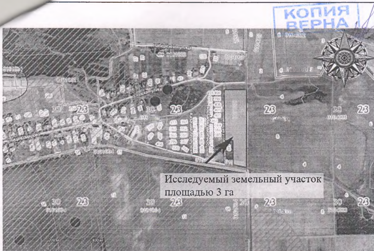
Илл. 3. Рассматриваемый земельный участок на космоснимке, а также территории и границы зон охраны ОКН.