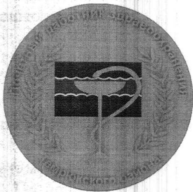
Рисунок нагрудного знака «Почетный работник здравоохранения Темрюкского района»

На оборотной стороне нагрудного знака расположено приспособление для крепления знака к одежде.